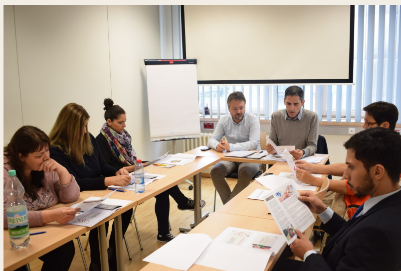
Notre équipe help desk sur le terrain, dans les établissements du groupe HRS

L'objectif de ces séances didactiques est de former les membres des équipes du Service des admis-