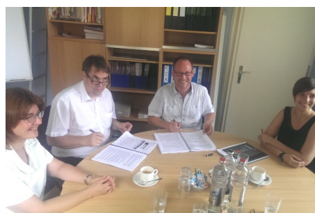
■ Fondation du Tricentenaire