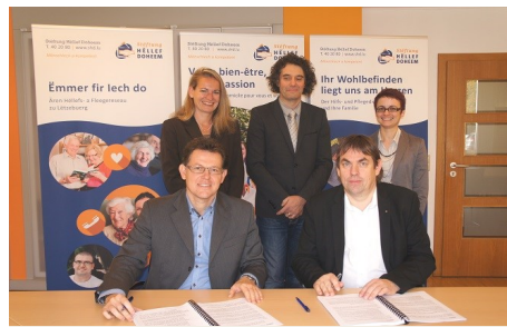
■ Stéftung Hëllef Doheim

L'Agence a déjà signé une dizaine de conventions de partenariat avec les établissements de santé et éditeurs de logiciels de cabinet de ville dans le cadre du déploiement du DSP pilote