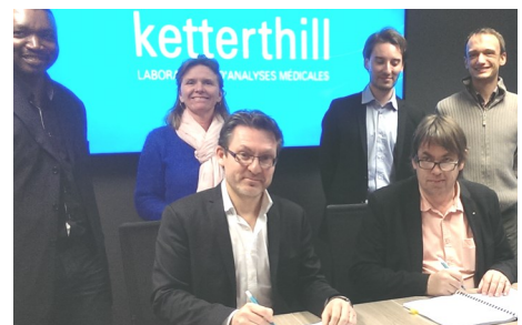
■ Laboratoire KetterThill