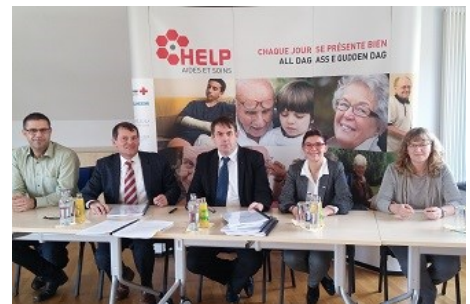
■ Réseau Help