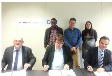
■ MAVEJA et BMS Engineering