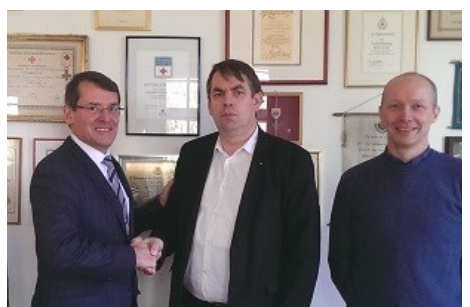
■ Croix Rouge Luxembourgeoise