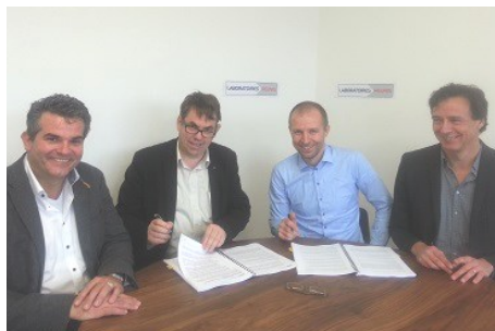
■ Laboratoires Réunis