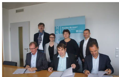
■ Hôpitaux Robert Schumann